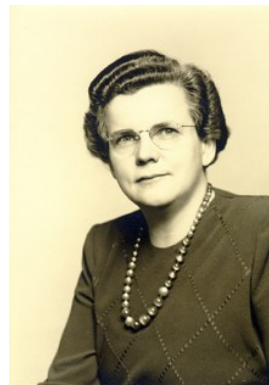
Gertrude Mary Cox

Der afholdes orienteringsmøde om fagudbud F19 i statistik/matematisk modellering for (kommende) studerende på tredje år af bachelorstudiet og på kandidatstudiet. Før mødet serveres sandwich og sodavand fra kl. 16.00 til 16.15.